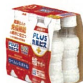
●[PLUSカルピス、免疫サポート] ラベルレスボトル