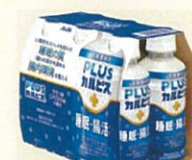
●[PLUSカルピス、睡眠・腸活ケア] PET200ml6本パック