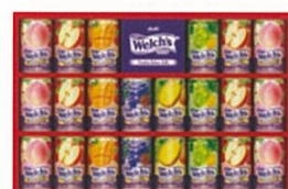
●Welch's ギフト W30T