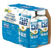
●[PLUSカルピス、体脂肪ケア]