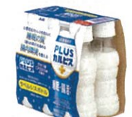
●[PLUSカルピス、睡眠・腸活ケア] ラベルレスボトル