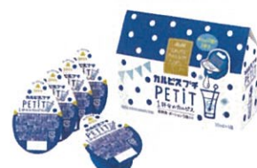
●[カルピス、プチ(PETIT)ギフト CP05N]