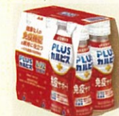
●[PLUSカルピス、免疫サポート] PET100ml6本パック