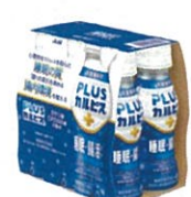
●[PLUSカルピス、睡眠・腸活ケア]