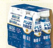
●[PLUSカルピス、睡眠・腸活ケア] PET100ml6本パック