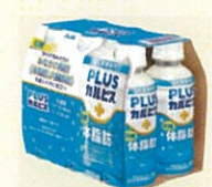
●[PLUSカルピス、体脂肪ケア] PET200ml6本パック