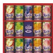
●Welch's ギフト W20T