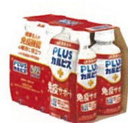
●[PLUSカルピス、免疫サポート]