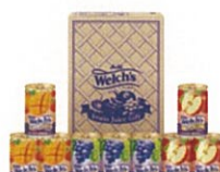
●Welch's ギフト W13