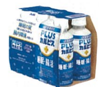
●[PLUSカルピス、睡眠・腸活ケア]