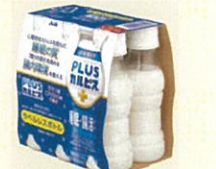
●[PLUSカルピス、睡眠・腸活ケア] ラベルレスボトル PET100ml6本パック