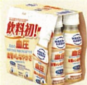
●アミールW PET100ml6本パック