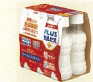
●[PLUSカルピス、免疫サポート] ラベルレスボトル PET100ml6本パック