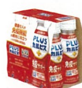
●[PLUSカルピス、免疫サポート]