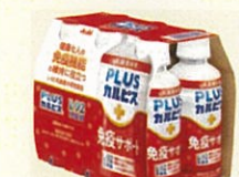
●[PLUSカルピス、免疫サポート] PET200ml6本パック